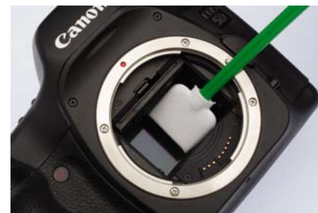
Bei hartnäckigen Feuchtigkeitspartikeln hilft nur die Nassreinigung mit speziellen Reinigungsstäbchen, im Bild die Swabs von VisibleDust

Anders als Naturhaarpinsel hat dieses technische Polymer keine kantigen Brüche oder Grate, die dem Sensor schaden könnten.