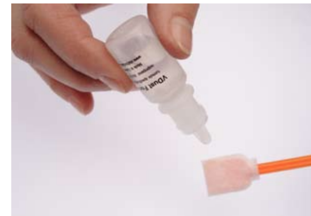
Ein Tropfen genügt, die feine Mikrostruktur der VisibleDust Swabs sorgt für eine optimale Aufnahme der Flüssigkeit

mit Adaptern für unterschiedliche Sensorgrößen stehen ebenfalls zur Verfügung. Der batteriebetriebene Arctic Butterfly Sensorpinsel besteht aus weichen Kunststofffasern, die eine besonders schonende Sensorreinigung ermöglichen.