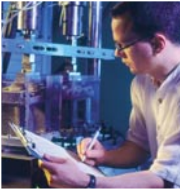
Die natürliche Darstellung von Menschen an der Arbeit erfordert vom Fotografen gutes Einfühlungsvermögen.

berücksichtigt werden. Wenns brennt, und das ist gerade bei Aufnahmen für Messeveranstaltungen oft der Fall, kann man z.B. mit einem Objekt kurzfristig ins Fotostudio gehen.