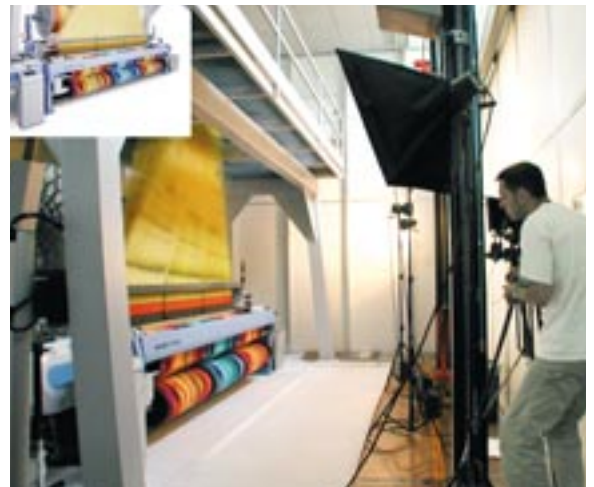
Grosse Maschinen und beschränkte Platzverhältnisse können zu extremen Weitwinkelsituationen führen.