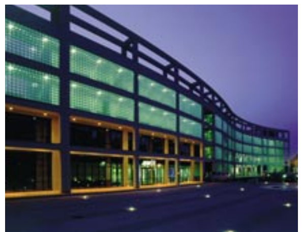
Gebäude, die bei Tageslicht unattraktiv wirken, können durch Dämmerlicht einen speziellen Charakter erhalten.